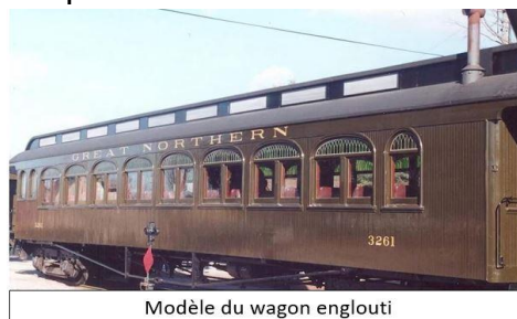
Modèle du wagon englouti

Le 11 novembre 1918, la première guerre mondiale prend fin avec la signature de l'armistice. De nombreux bateaux sont alors mis à la disposition des soldats pour les ramener au pays. Le port d'Halifax est un des principaux endroits pour le retour des soldats.