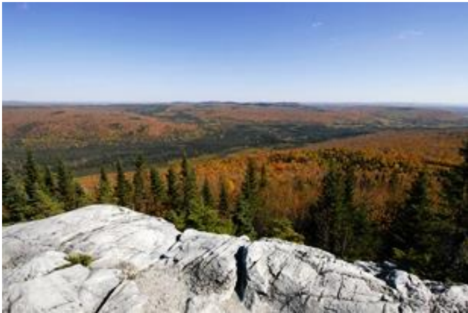
Vue du Mont Thompson

Afin de valider certains renseignements recueillis ici et là, et de vous informer au mieux, un appel à la Municipalité de Saint-Athanase s'avère pertinent.