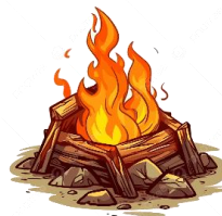
Isabelle Gariépy, Agente à la prévention et aux communications SOPFEU

Depuis le début de la saison de protection au Québec, 299 incendies combattus en zone de protection intensive ont affecté 16 961 hectares de forêt. La SOPFEU tient à rappeler qu'environ 80 % de ces incendies sont imputables à l'activité humaine. La collaboration de tous demeure essentielle pour en réduire le nombre. Évitions les feux évitables.