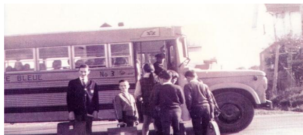
Autobus scolaire du Rang VI, Adjutor Tanguay est le conducteur

Puis ce furent les autobus scolaires. Adieu les petites écoles de rang!